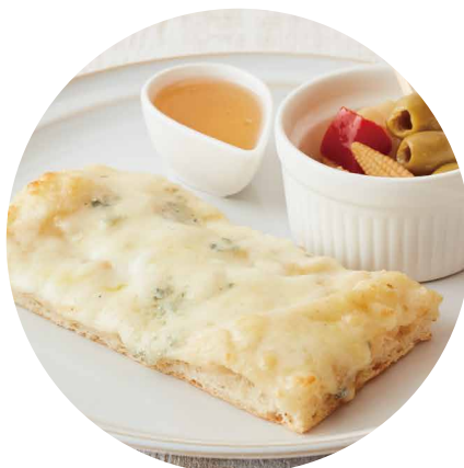
クアトロフォルマッジョ