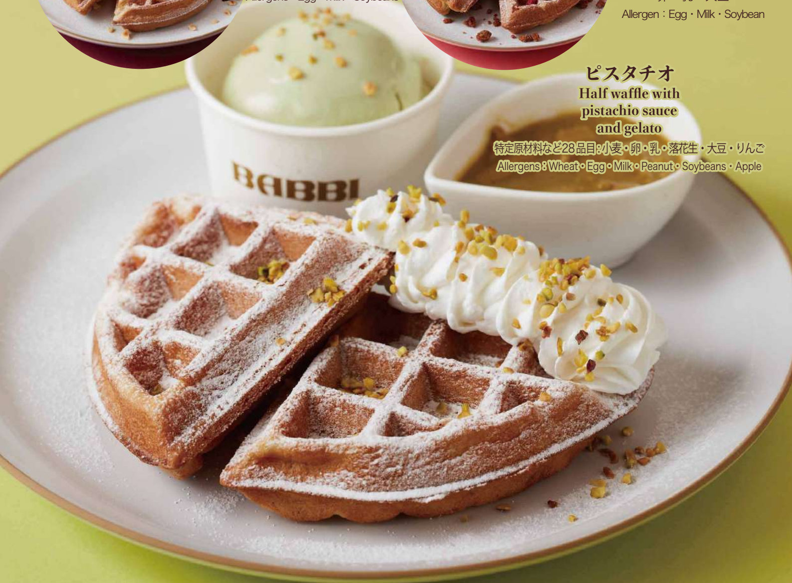
ピスタチオ Half waffle with pistachio sauce and gelato

特定原材料など28品目:小麦・卵・乳・落花生・大豆・りんご Allergens : Wheat · Egg · Milk · Peanut · Soybeans · Apple