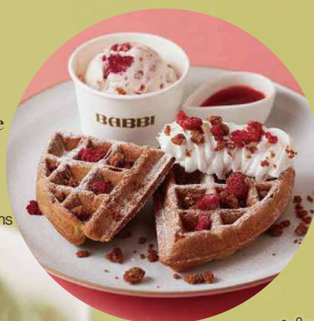
ラズベリーホワイトチョコ Waffle with Raspberry White Choco Gelato & Strawberry Sauce