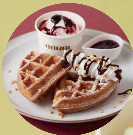
アマレーナ Half waffle with Amarena cherry sauce and gelato