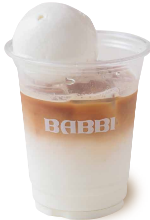
カフェラテフロート