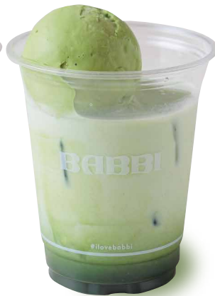
抹茶ラテフロート