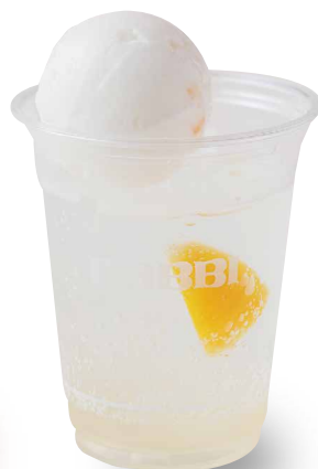
クラシックブルー マンゴーパッションフルーツ Classic Blue Mango Passion Fruit