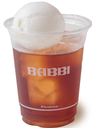
アールグレイフロート