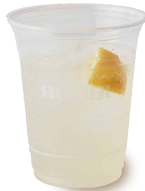
クラシックブルー マンゴーパッションフルーツ ソーダ ソーダ