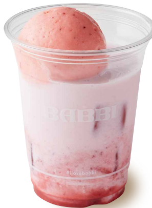
ストロベリーラテフロート