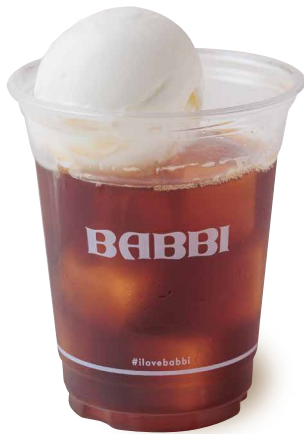
コーヒーフロート