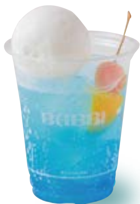
クラシックブルー