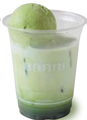
抹茶ラテフロート