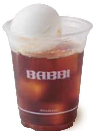
コーヒーフロート