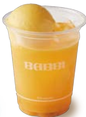
マンゴーパッションフルーツ