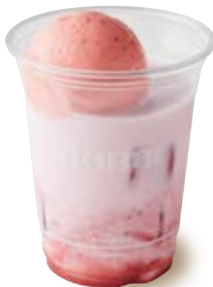
ストロベリーラテフロート