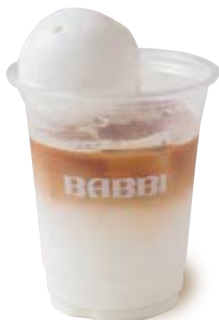
カフェ・ラテフロート