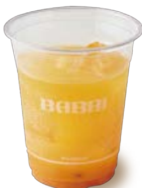
マンゴーパッションフルーツ