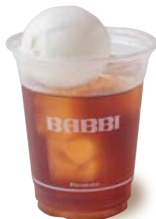
アールグレイフロート