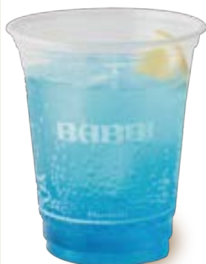
クラシックブルー